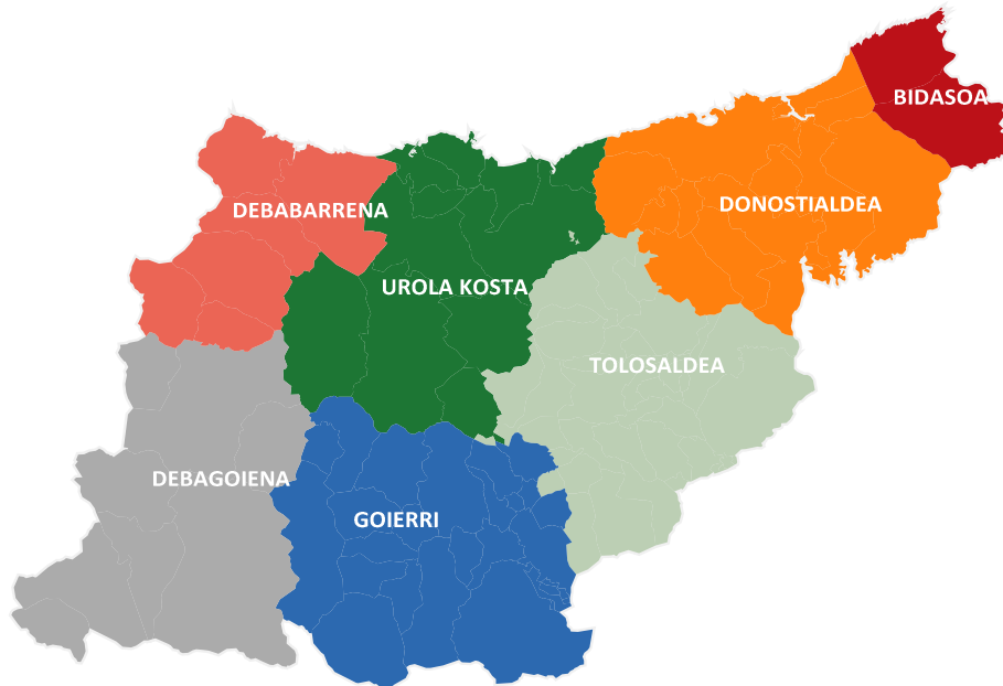
Mapa 2- Comarcas administrativas de Gipuzkoa