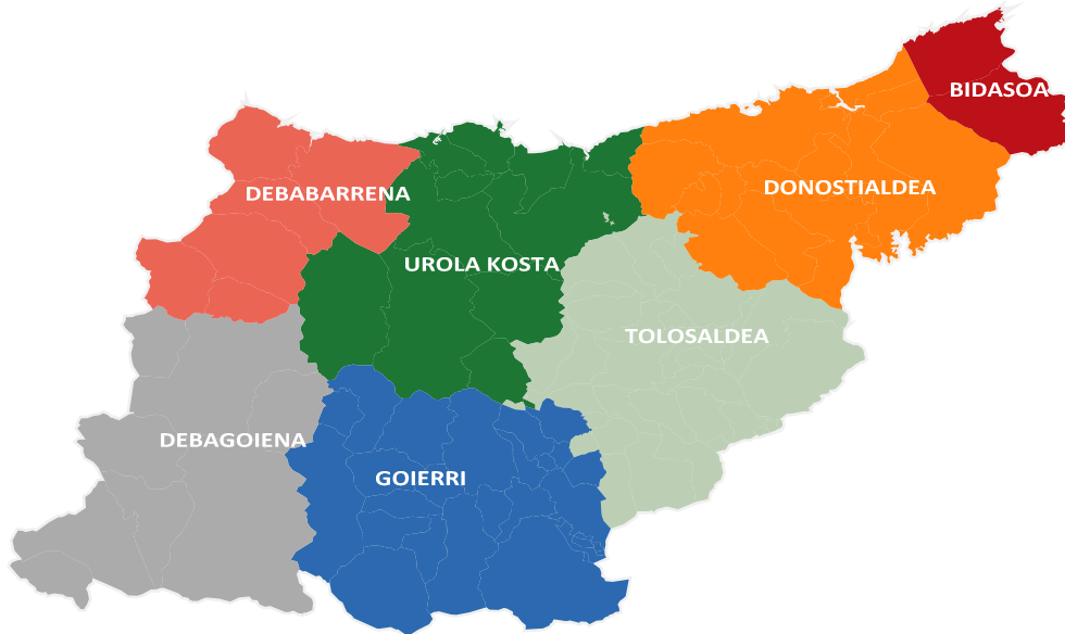
2. mapa. Gipuzkoako eskualde administratiboak